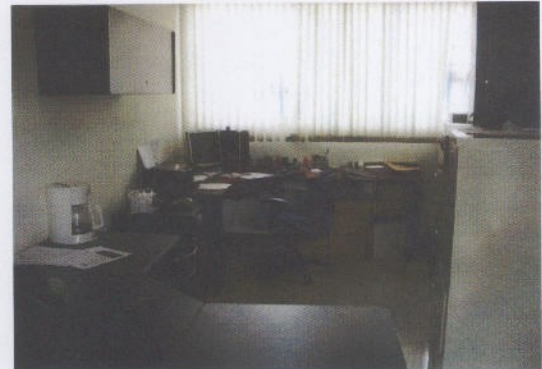
Fotografía 6 Oficina Subgerencia