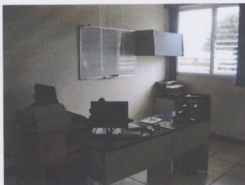
Fotografía 11: Oficina 3 en Medición

Además como funcionarios públicos debemos asegurarnos que las decisiones que adoptemos en cumplimiento de nuestras atribuciones se ajustan a la imparcialidad y a los objetivos propios de la institución en la que nos desempeñamos, administrando los recursos públicos con apego a los principios de legalidad, eficacia, eficiencia y economía, rindiendo cuentas satisfactoriamente.