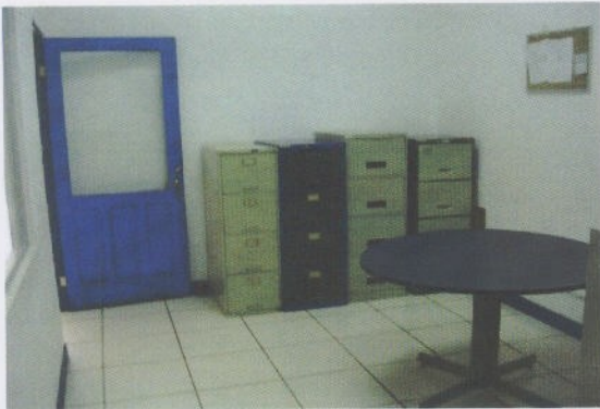
Fotografía 9: Oficina 1 en Medición

En el área de Medición: Existen tres oficinas que se podrían reacomodar y ubicar temporalmente a varios funcionarios. (Ver fotografías 9, 10 y 11).