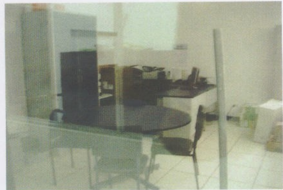
Fotografía 10: Oficina 2 en Medición