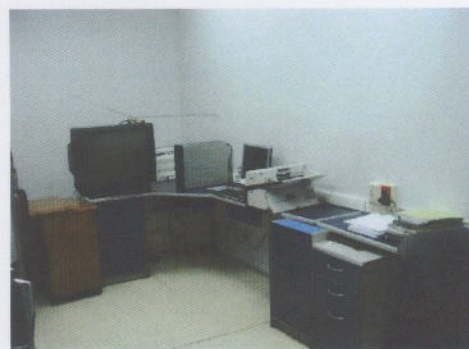
Fotografía 2: Oficina Jenny R.C.

Segundo piso: Oficina que ocupaba anteriormente la encargada de Hurtos, además ocupar temporalmente una de las salas de reuniones que pertenece a la Gerencia. (Ver fotografías 3 y 4).