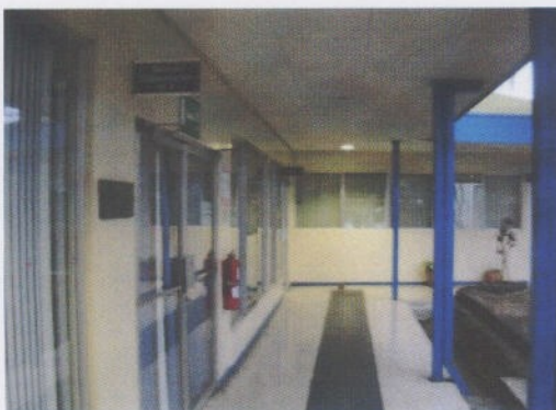
Fotografía 7: Salas de Capacitación