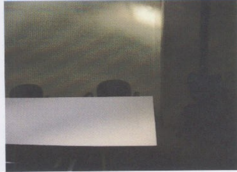
Fotografía 4: Sala reuniones Gerencia