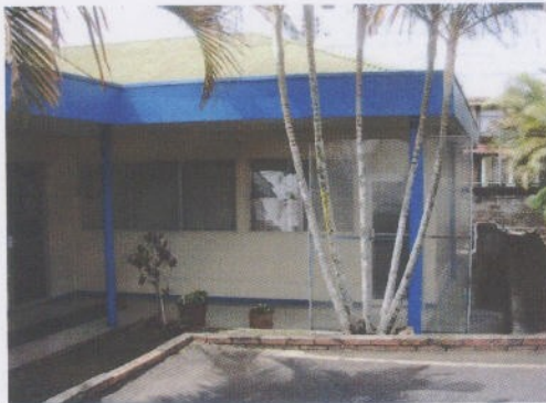
Fotografía 5 Oficina Subgerencia

Antiguas oficinas utilizadas por la Subgerencia y una de las salas de capacitación. (Ver fotografías 5, 6, 7 y 8).