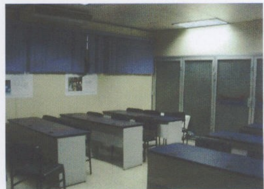
Fotografía 8: Sala de Capacitación