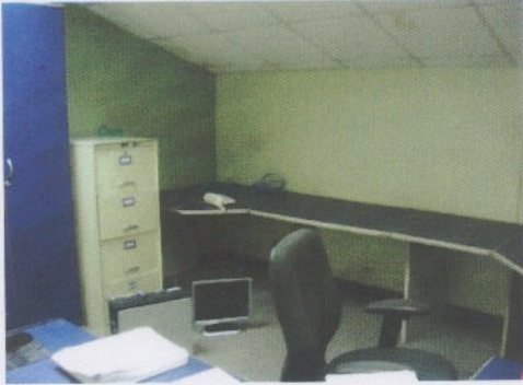
Fotografía 3: Oficina Hurtos