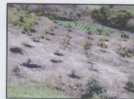
Cultivos Agro conservacionistas

Aporte de más de ¢300 millones en proyectos demostrativos en los últimos 8 años