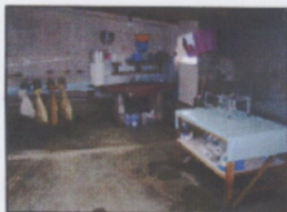
Producción de Biogás