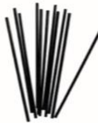
Removedores de café