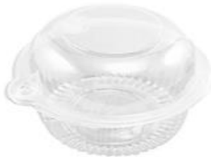
Cápsulas para comida