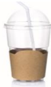
Envases para batidos