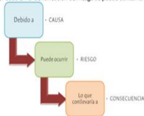
Figura 13. Frase del riesgo

Para subsanar cualquier duda en la identificación del riesgo se puede utilizar la frase del riesgo: