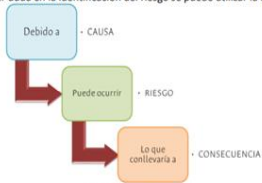
Figura 13. Frase del riesgo

Para subsanar cualquier duda en la identificación del riesgo se puede utilizar la frase del riesgo: